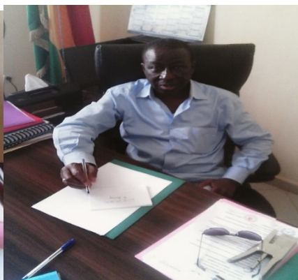
Chargé de l'organisation des collectivités à Boké à gauche et vice maire de la commune urbaine à droite