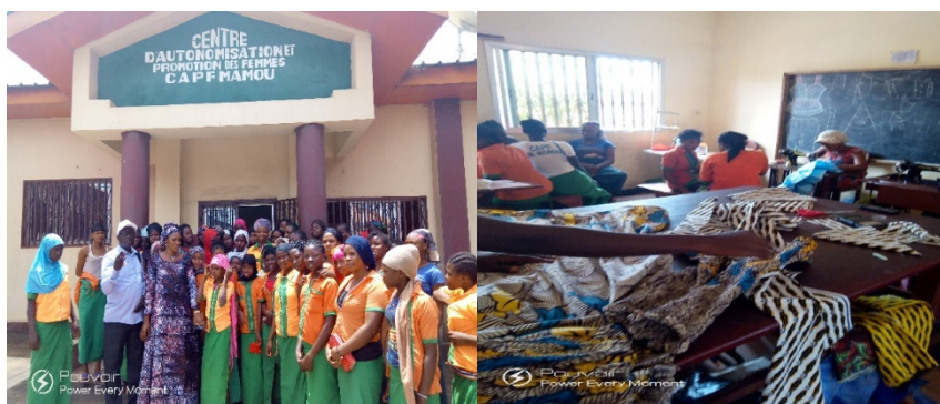
Entretien au Centre d'Appui à l'Auto promotion Féminine de Mamou