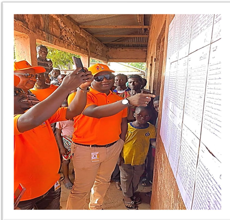
Affichage de la liste ménages dans le district de Dianeya, Sous-préfecture de Moussayah