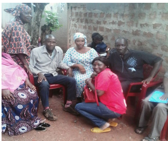
Consultation des parties prenantes dans le quartier Dibia dans CU de Boké

Les détails des résultats de consultation par localité et par catégorie d'acteurs sont présentés en annexe 3 de ce rapport.