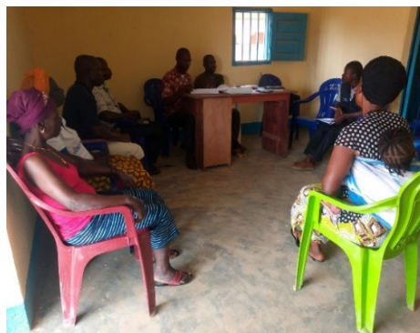
Entretien avec l'ONG ABEEF (à gauche) et l'ONG ADIFA (à droite)