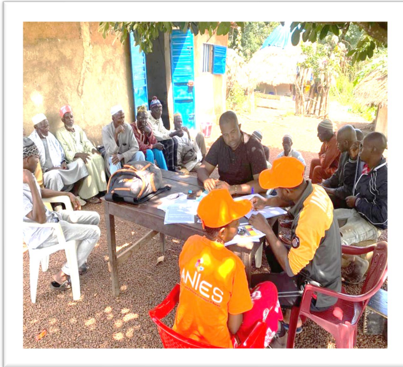
Supervision des opérations de validation communautaire dans le district de Dianeya, Sous-préfecture de Moussayah