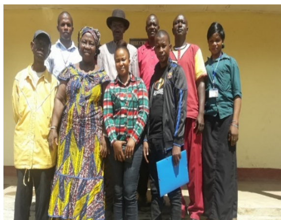
Consultation au Centre d'Appui à l'Auto promotion Féminine de Nzérékoré